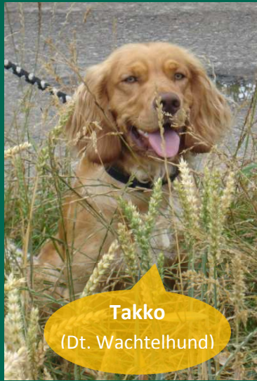
Takko (Dt. Wachtelhund)